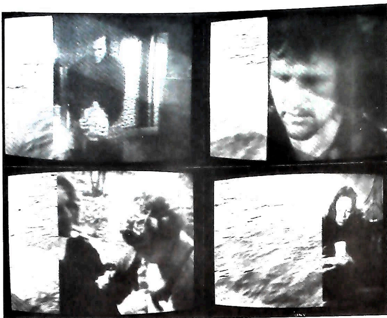
Cross-talks No. 2 Liège, Radio-Télévision Belge, 1977. Sony U-Matic, cassette 3/4", 13 min.

La partie droite de l'écran montre une sélection de micro-événements prise des programmes divers des télévisions reçues à Liège durant les quelques jours qui ont précédé ma construction. De préférence, j'ai pris des situations transitives, des passages dans les corridors ou l'espace des portes qui s'ouvrent. L'anthologie qui en résulte ne propose donc pas un récit linéaire, mais tente de montrer les schèmes et les variantes dont dispose la télévision lorsqu'elle "met en scène" des scénarios similaires : commissariat