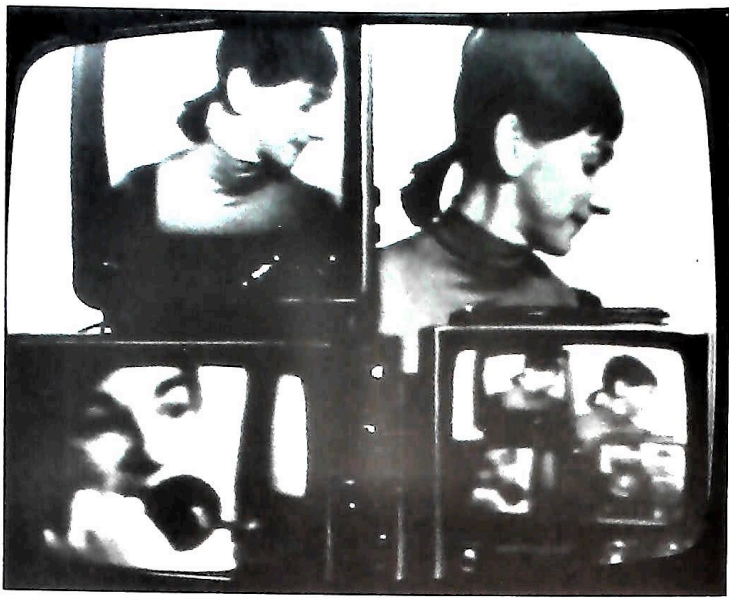
Photographie extraite de High Fidelity .