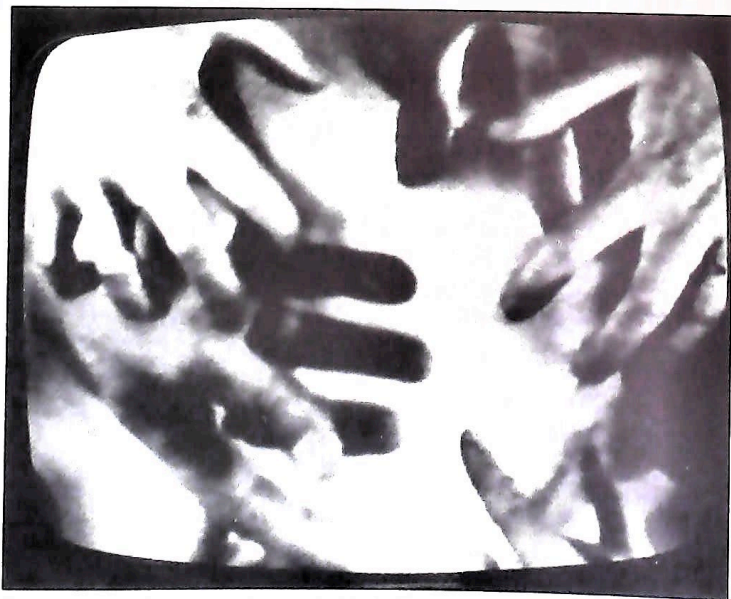
Photographie extraite de Transvidéo .

Si je tentais de définir quelques constantes dans ma pratique de la vidéo, je ne pourrais le faire que de manière très subjective. Il y a toujours cet imperceptible mouvement de dérive, ces décalages, ces glissements subtils avec lesquels il est difficile de composer. Vu de l'intérieur et pris dans le vertige du feed-back de mes fantasmes électroniques, il devient hasardeux d'évaluer une distance ou d'apprécier la consistance d'une réalité. Je préfère donc évoquer mes préoccupations du moment. La recherche vidéographique, dans le secteur de l'art, est caractérisée par un état de pauvreté endémique. C'est donc par opportunité que je m'intéresse en priorité, non pas à une théorie de la stratégie, mais à quelques concepts qui en découlent et dont les applications tactiques favorisent l'établissement de procédures inhabituelles préfigurant des voies de retour inédites. A défaut de dispositifs sophistiqués et coûteux, qui élargiraient singulièrement l'éventail des possibilités, j'essaie de créer des conditions et des modalités d'intervention qui fonctionnent dans la réciprocité. Ces échanges sur échiquier électronique tiennent dans l'espace d'une fourchette qui, logiquement, s'amenuise. Mais la dimension fictive dans laquelle se réfléchit la dialectique du jeu des miroirs n'est pas uniquement circonscrite par des limites technologiques; l'ingénuité de l'artiste peut, finalement, se révéler plus astucieuse qu'elle ne le paraît.