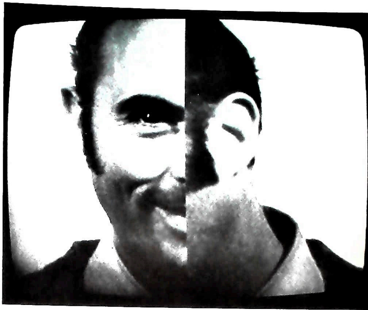
Photographie extraite de Aléatoire I et II .

La seconde phase permet au sujet qui se prête à l'expérience de revoir, en différé, la moitié gauche de son visage par lecture de la bande (un générateur d'effets partage l'écran du moniteur en deux parties égales selon l'axe de symétrie du visage), tandis que la moitié droite est parallèlement reproduite en direct par l'intermédiaire de l'autre caméra. Les deux moitiés ainsi juxtaposées sur l'écran recomposent la totalité du visage.